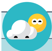
Photo publiée le 11 août sur le compte Instagram villededieppe .

Vue imprenable depuis la grande roue. #foirededieppe #dieppe #feteforaine #frontdemer #villededieppe #feteforainededieppes